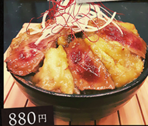
牛肉とナスの旨たれ丼