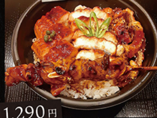
大人のうな丼 肝串付き