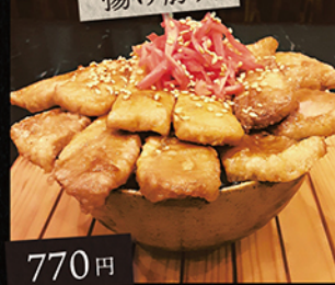
やみつぎ揚げ豚丼